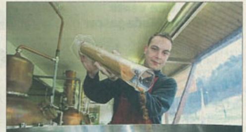
La préparation d'épices est mélangée à une base d'alcool, en vue de la macération.