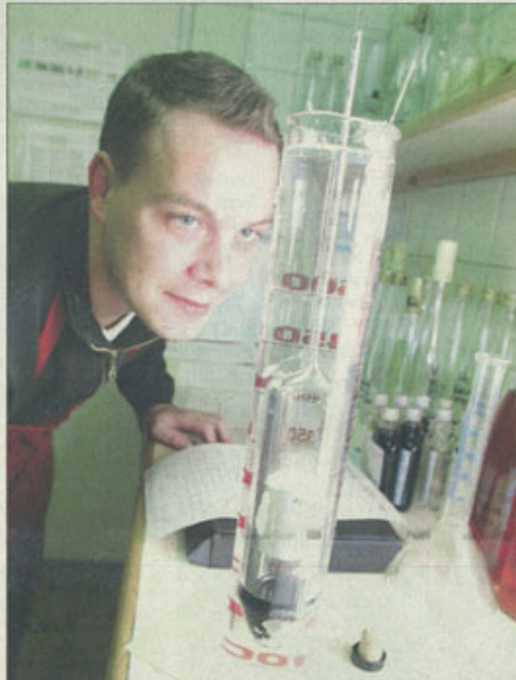
La concentration en alcool du breuvage est ajustée, pour arriver aux alentours de 18°.