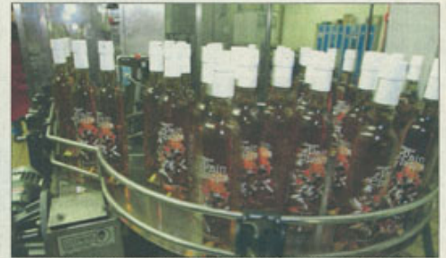
Sur la chaîne d'emballage de la distillerie Miclo. L'entreprise emploie une vingtaine de personnes.