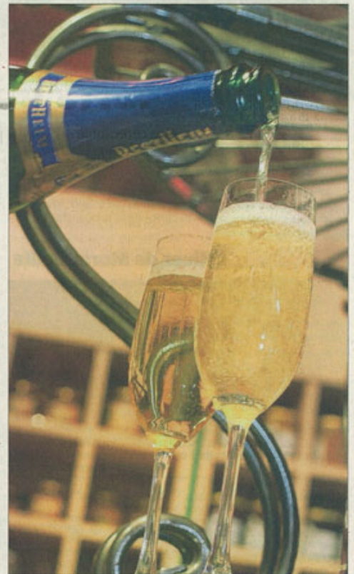
Cocktails ou recettes de cuisines : l'équipe Miclo a imaginé de nombreuses utilisations possibles de sa liqueur.

Nous y suivrons pas à pas, la fabrication d'une des 20 sortes de liqueurs de la gamme de l'établissement, qui fabrique également 40 sortes d'eaux de vie.