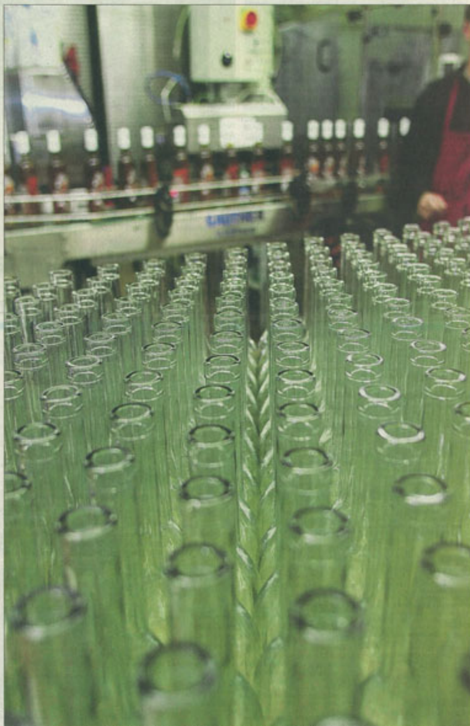
Depuis un mois, la distillerie Mico a produit à Lapoutroie 6000 bouteilles de liqueur de pain d'épices : les fêtes de fin d'année approchent.