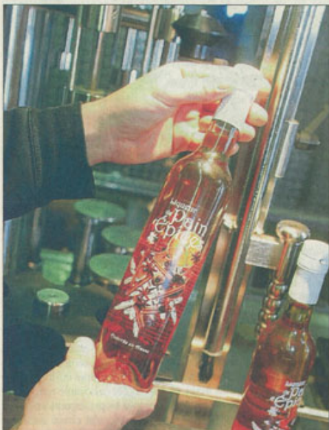
La distillerie a revu le design de son produit phare, pour en faire la promotion au moment des fêtes.