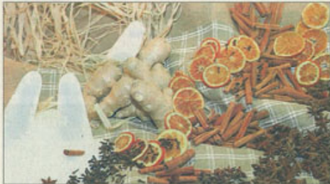
Cardamome, gingembre, clou de girofle, sucre : avec les ingrédients de la liqueur de pain d'épices, on pourrait aussi préparer du vin chaud.