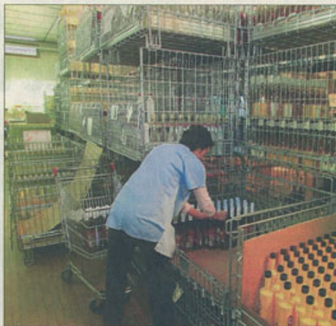
La salle de stocks de l'établissement, qui gère 40 sortes d'eaux de vie, 20 de liqueurs et 15 de crèmes de fruits.