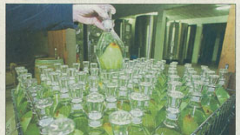
Une autre spécialité de la maison, les poires dans leurs bouteilles, qui sont mises en place sur l'arbre lui-même.