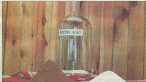
Depuis plus de 10 ans, la distillerie Miclo à Lapoutroie fabrique de la liqueur de pain d'épices, et revendique une place de précurseur sur ce produit.