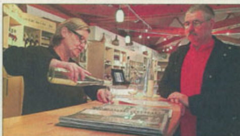
Pour diffuser ses produits, la distillerie Miclo s'appuie sur des cavistes et des grossistes, mais aussi sur trois boutiques, à Kaysersberg, Riquewihr et Lapoutroie.