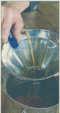
Après une macération de 21 jours au minimum, le contenu des cuves est filtré.

Cette semaine, nous vous proposons de retrouver le deuxième volet de notre série « Au fil de la chaîne », avec une visite en images de la distillerie Miclo à Lapoutroie.